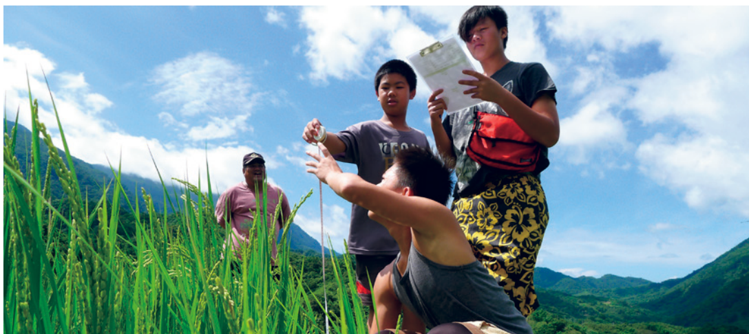
花蓮豐南村阿美族里山部落課程

以TPSI經營、串聯韌性SEPLS的治理模式中，地景取徑及調適性經營將扮演非常重要的角色。地景取徑係採地景—海景尺度、透過不同權益關係人的協同規劃和經營來平衡