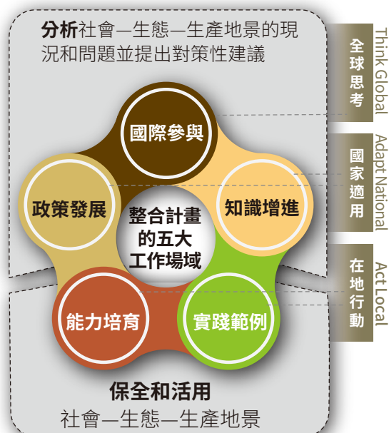
③ 2020年後臺灣里山倡議策略架構（上）及其推動架構的五個工作領域（下）